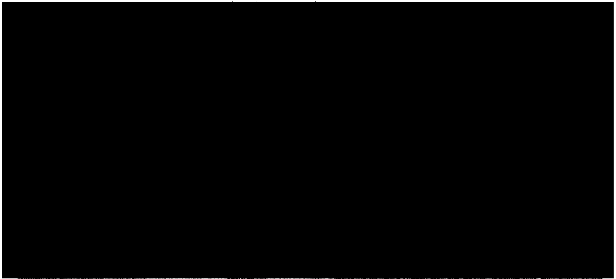
IMAGEN DE GOGLE EARTH DEL LUGAR OBJETO DE LA VISITA DE INSPECCION: