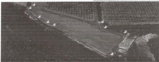
IMAGEN SATELITAL DEL POLIGONO

A CONTINUACION SE CITAN LOS POLIGONOS: TOMADOS EN COORDENADAS UTM: R 13Q, LOS CUALES FUERON TOMADOS CON UN APARATO PORTATIL GPS MARCA GARMIN GPS MAP 76S QUE A CONTINUACION SE DESCRIBE: