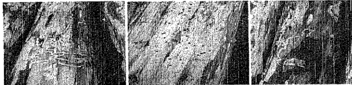
Imágenes de evidencia de la afectación de la plaga identificada como Scolytus mundus en la materia prima forestal.

En lo que respecta al numeral 11.G se le solicita al Visitado la documentación para acreditar la legal procedencia de las materia prima forestales que se han extraído resultado del saneamiento forestal, Visitado menciona no contar con estas al momento de la inspección pero las proporcionará en tiempo y forma al finalizar el saneamiento forestal.