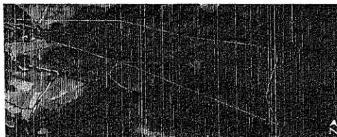
Imagen de los terrenos que comprenden el Área de Uso Común del Ejido Tenaxtepec y sus Anexos San Agustín y El Escobillo, Paraje Barranca El Rosillo, con una superficie total de 130,164 M 2 .

En una superficie de 130,164 M 2 en donde se están realizando los trabajos de saneamiento forestal, la cual se encuentra dentro del polígono autorizado de acuerdo a las disposiciones contenidas en el Oficio No. CNF/GEVER/0681/2020, de fecha 30 de octubre de 2020 emitido por la Comisión Nacional Forestal: CONAFOR