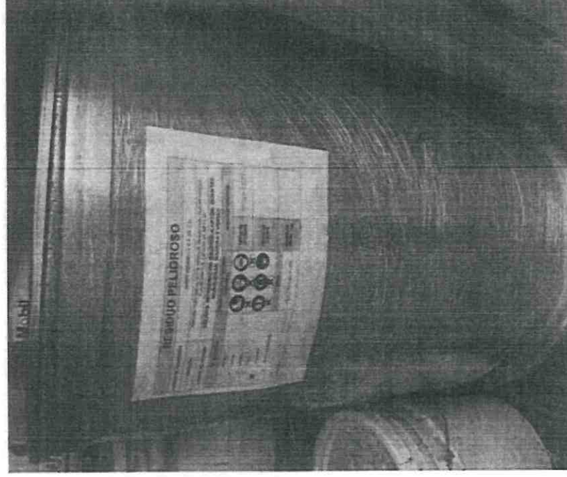
Fotografía 3. Vista del etiquetado de los contenedores de residuos peligrosos

alusivos de la peligrosidad de los residuos peligrosos. Con referencia al inciso H se presenta en el anexo 3 memoria fotográfica de la identificación de los contenedores de los residuos peligrosos de acuerdo con lo que se indica el en "Reglamento de la ley general para la prevención y gestión integral de los residuos, en el Artículo 46.- en el inciso IV. Marcar o etiquetar los envases que contienen residuos peligrosos con rótulos que señalen nombre del generador, nombre del residuo peligroso, características de peligrosidad y fecha de ingreso al almacén y lo que establezcan las normas oficiales mexicanas aplicables,"