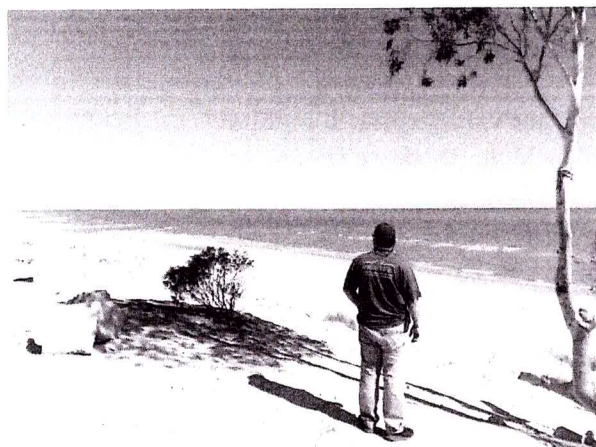
RECORRIDO TERRESTRE DE INSPECCIÓN Y VIGILANCIA, EN COORDINACIÓN CON DISTINTAS AUTORIDADES.