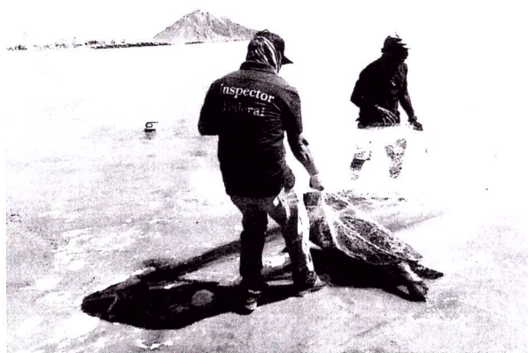
ATENCIÓN A VARAMIENTO DE MAMÍFEROS MARINOS.