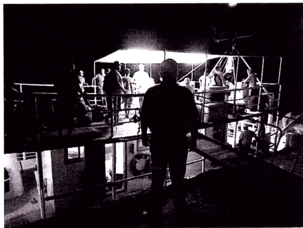
REVISIÓN DE EMBARCACIONES EN SITIOS DE EMBARQUE Y DESEMBARQUE.