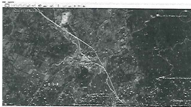
Ubicaci3n del Ejido Pueblo Nuevo, municipio de Villa Comaltitlan, Chiapas

La presente comisi3n se realiza en seguimiento al oficio de comisi3n n3mero PFPA/12/0132/2025 de fecha 26 de enero de 2026, me traslade al ejido Pueblo Nuevo, municipio de Villa Comaltitlan, Chiapas.