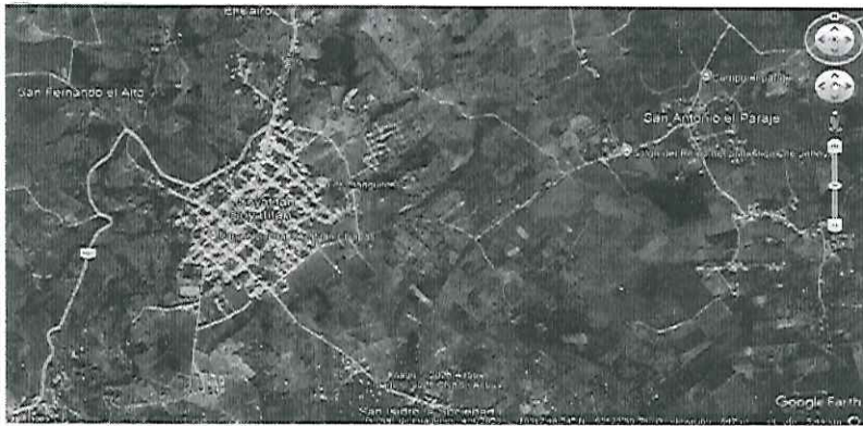
Ubicación del Ejido Soyatitan, municipio de Venustiano Carranza, Chiapas