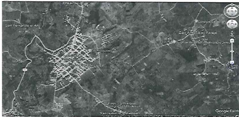
Ubicaci3n del Ejido Soyatitan, municipio de Venustiano Carranza, Chiapas