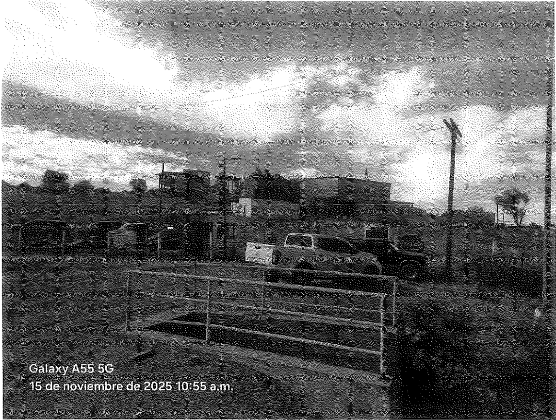
Galaxy A55 5G 15 de noviembre de 2025 10:55 a.m.