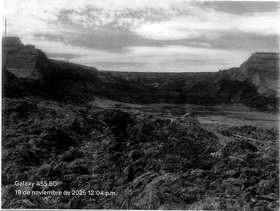
Galaxy A55 5G 19 de noviembre de 2025 12:04 p.m.