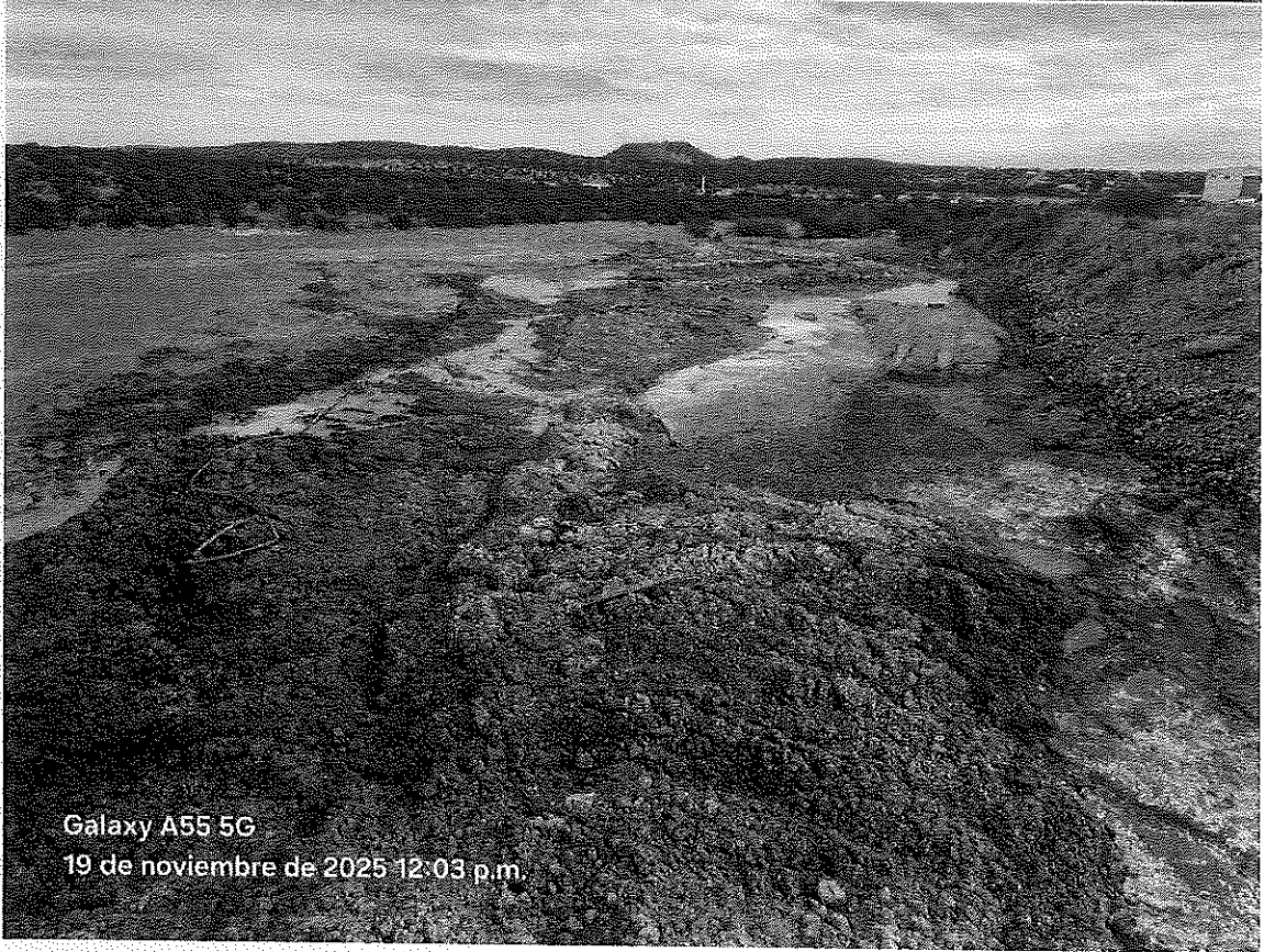
Galaxy A55 5G 19 de noviembre de 2025 12:03 p.m.