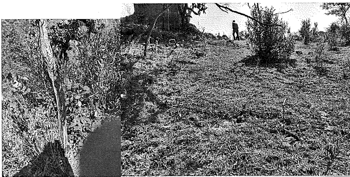
Imagen 4 y 5. En esta imagen se observa los indicios del uso de fuego en el área afectada, así como el establecimiento de especies indicadoras de disturbio.

Imágenes 2 y 3. En estas imágenes se observa las áreas afectadas de los dos polígonos, por las actividades de Cambio de Uso de Suelo en Terreno Forestal.