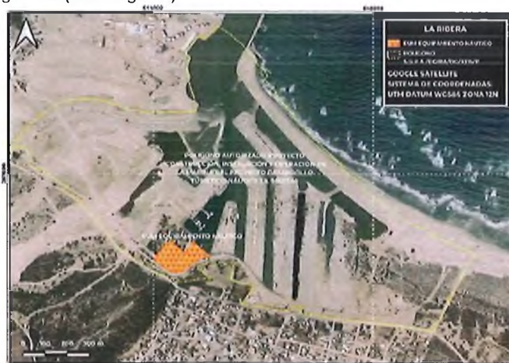
Imagen 2. Ubicación del EUM Equipamiento Náutico

En este sentido, se procede a verificar si EUM Equipamiento Urbano Náutico se ubica dentro del polígono autorizado en el oficio resolutivo S.G.P.A./DGIRA/DG/3315/11, de veintiocho de abril de dos mil once, para lo cual se elaboró el plano georreferenciado siguiente (ver imagen 2):