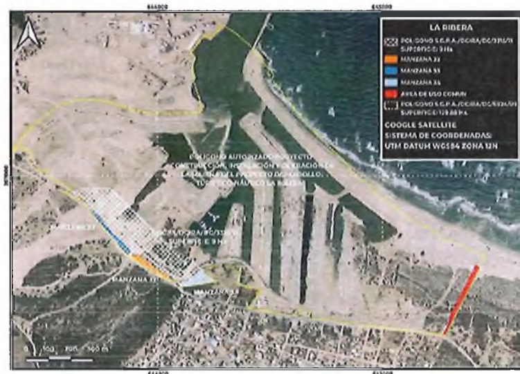
Imagen 1. Ubicación de las obras

Inspeccionado: DESARROLLADORA LA RIBERA, S. DE R.L. DE C.V., PROMOVENTE DEL PROYECTO "CONSTRUCCIÓN, INSTALACIÓN Y OPERACIÓN DE LA MARINA DEL DESARROLLO TURÍSTICO-NAÚTICO LA RIBERA"