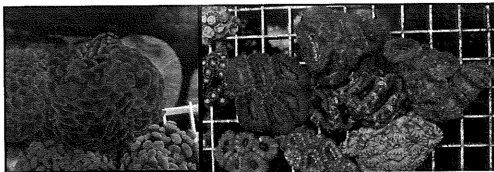
Cuadro 3.- Ilustración 3 ejemplares de Euphillia torch y Acanthastrea lordhowensis,