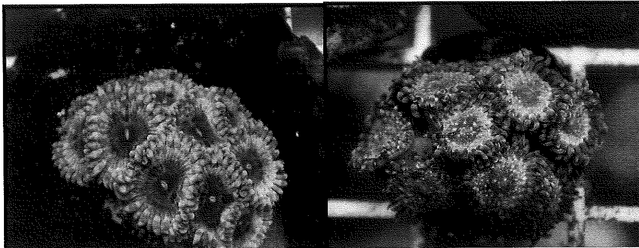
Cuadro 2.- Ilustración 2 ejemplares de Zoanthidos/ Palithoa localizados en el domicilio sujeto a inspección.

ELIMINADO: CINCO PALABRAS, FUNDAMENTO LEGAL: ARTICULO 116 PARRAFO PRIMERO DE LA LGTAIP, CON RELACION AL ARTICULO 113. FRACCION I, DE LA LGTAIP, EN VIRTUD DE TRATARSE DE INFORMACION CONSIDERADA COMO CONFIDENCIAL LA QUE CONTIENE DATOS PERSONALES CONCERNIENTES A UNA PERSONA IDENTIFICADA IDENTIFICABLE