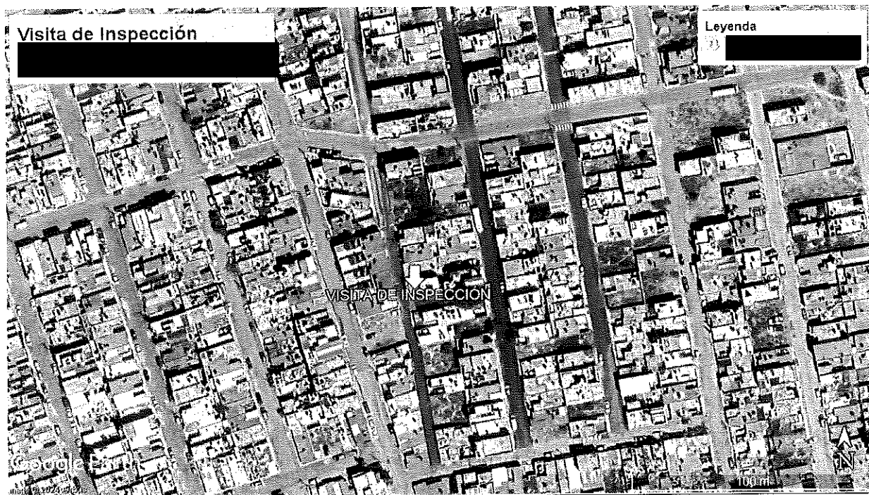
Imagen satelital correspondiente a la ubicación del domicilio sujeto a inspección en el municipio de Zacatecas, Estado de Zacatecas.