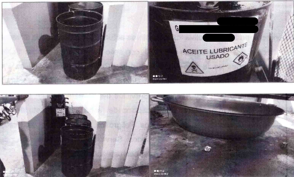
Imágenes del área específica para el almacenamiento temporal de los Residuos Peligrosos.

SECRETARÍA DE MEDIO AMBIENTE Y RECURSOS NATURALES