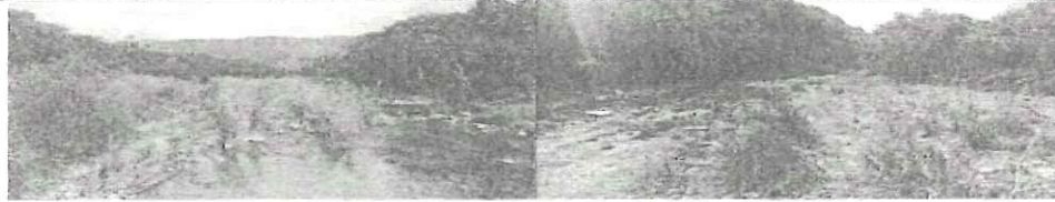
Imágenes del [REDACTED] lugar donde se realizó recorrido