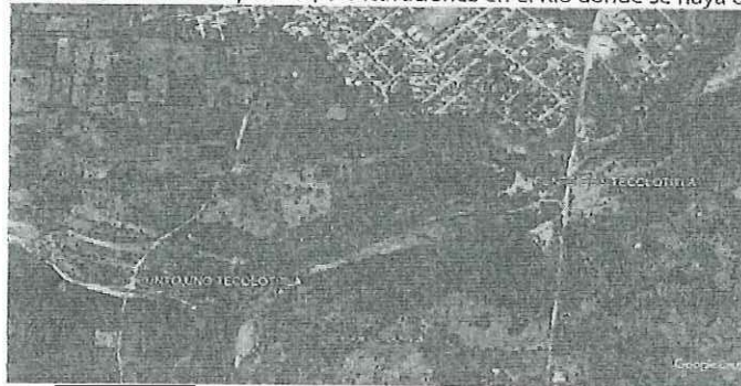
Imagen Satelital del [REDACTED] donde se observan los puntos donde se realizó recorrido. Del Puente de [REDACTED]

rivera del Río, no se observa que se haya realizado la extracción de material pétreo, ya que no se observan indicios de entradas de camiones maquinaria, o excavaciones en el Río donde se haya extraído material.