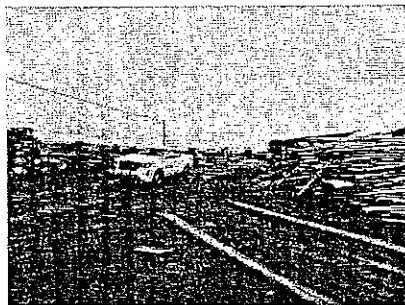
Imagen I. Patio para almacenamiento de madera en rollo.