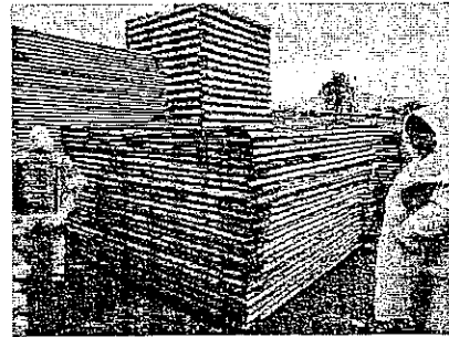
Imagen II. Inventario de productos forestales maderables (Tabla), de Pinus sp. , Pino.

Nota: cabe mencionar que, derivado de las presentes lluvias, la medición de la trocería y cuantificación de los productos forestales, fue realizada en intervalos, dado que la lluvia no permitía los trabajos de manera continua.