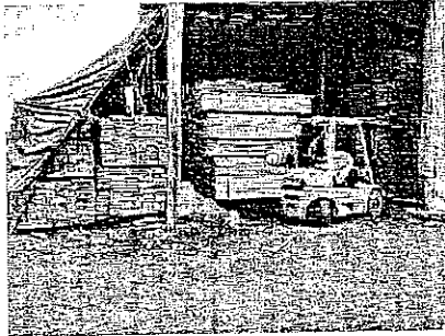
Imagen VI. Bodega para almacen de productos forestales maderables.