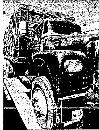
Vista del estado actual de los bienes

Una vez concluidos los trabajos, nos trasladamos al municipio de San Matías Tlalancalca, a fin de llevar a cabo la notificación de la resolución administrativa de fecha 13/03/2025 a la empresa denominada Lavados Industriales Moniquita, dentro del expediente PFFA/27.2/2C.27.1/00031-24, en donde se llevó a cabo la notificación personal