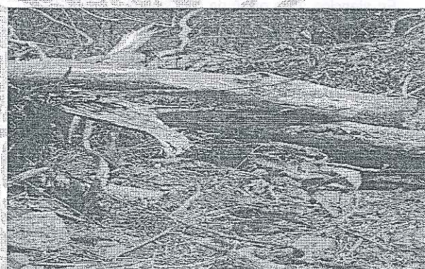
Vista panoramica del camino aperturado