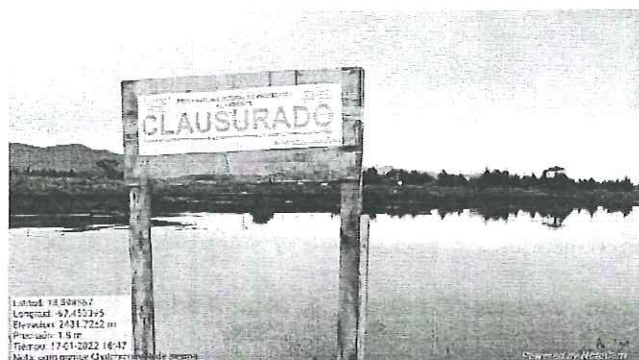
Imposición de sello de clausura