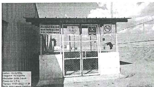
Almacén de residuos peligrosos