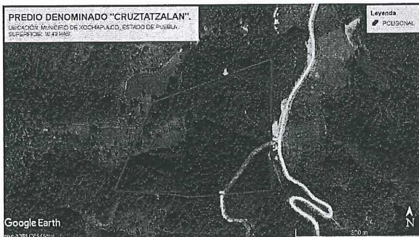
Imagen de fecha: 10/6/2021

De acuerdo a las coordenadas que delimitan el área autorizada en la autorización se estima un área de 2.62 ha.