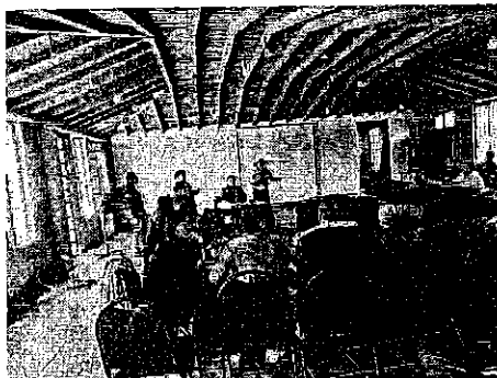
Vista de los participantes en dicho taller

Así mismo, personal de esta ORPAYGT, impartió el tema "Legislación Ambiental" en materia de vida silvestre, contando con la participación de personal de Bienestar animal del H. Ayuntamiento de Tehuacán, estado de Puebla, Asociaciones civiles, personal del ANP "Reserva de la Biosfera Tehuacán-Cuicatlán y personas de las comunidades. Al término de la ponencia se realizó una practica de campo para conocer los diferentes tipos de trampas utilizados en la captura de mamíferos silvestres.