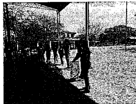
Imagen de la Práctica de campo llevada a cabo