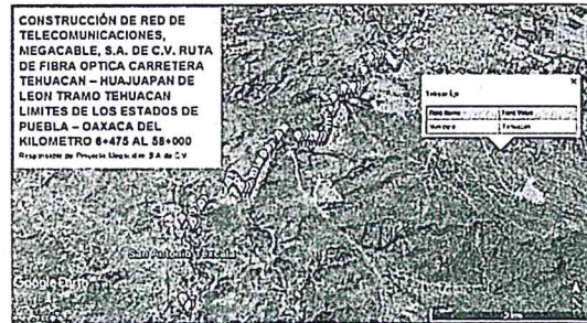
Fotografías Satelitales Fecha: 15/01/2017

Asimismo, es importante mencionar que las actividades de sembrado de postes se ha realizado dentro del derecho de vía de la Carretera Federal 125 Tehuacán – Huajuapán de León a distancias variables de los hombros de la carretera de 1 hasta 3 metros, y además se encuentra dentro de la Poligonal de la Reserva de la Biosfera Tehuacán – Cuicatlán, en la Zonificación “Zona de Amortiguamiento” y Subzonificación “Aprovechamiento Sustentable de los Ecosistemas”, de acuerdo a lo establecido en el Programa de Manejo del Área Natural Protegida, cuyo resumen fue publicado en el diario oficial de la federación el 08 de junio de 2012, tal como se muestra en la siguiente imagen satelital obtenida del programa Google Earth Pro.