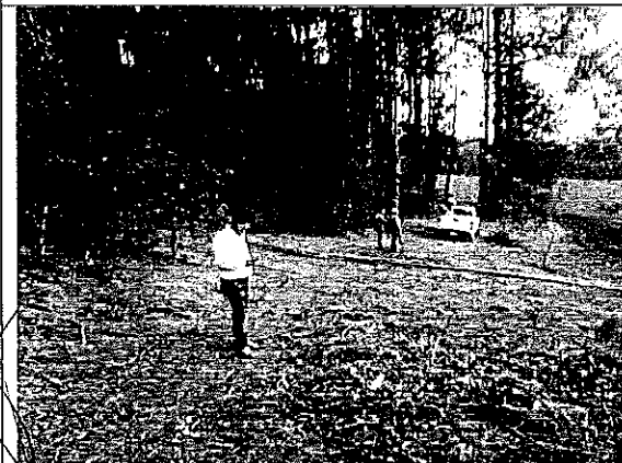
Imagen V.- Toma de coordenadas de área de arbolado marcado aun en pie.