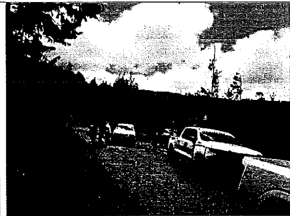
Imagen IV.- Recorrido Vigilancia por áreas boscosas del Municipio de Zacatlán, Puebla.