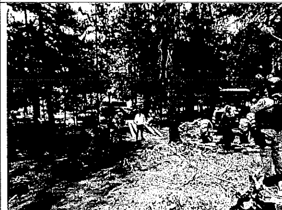
Imagen III.- Revisión de documentación del aprovechamiento Forestal Maderable por Cambio de Uso de Suelo en Terrenos Forestales.