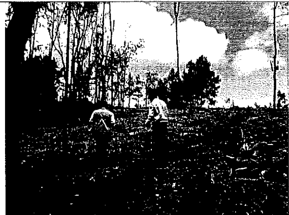
Imagen II.- Área de Cambio de Uso de Suelo en Terrenos Forestales.