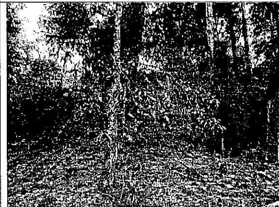
Imagen VI.- Árbol aun en pie con marca de martillo forestal.