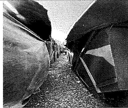
CONTENEDORES METÁLICOS VACIOS Y CUBIERTOS

UNA VEZ REALIZADO EL RECORRIDO POR AMBOS SITIOS SEÑALADOS POR LOS DENUNCIANTES DONDE SE PRESENTAN LAS DIVERSAS PROBLEMÁTICAS, SE PROCEDIÓ A CONCLUIR LAS DILIGENCIAS EN PUNTO DE LAS 16 (DIECISÉIS) HORAS CON 00 (CERO) MINUTOS DE LOS DÍAS 10 Y 11 DE ABRIL, PROCEDIENDO A RETORNAR A LA CIUDAD DE PUEBLA.