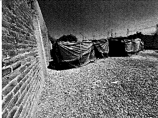
CONTENEDORES METÁLICOS VACIOS Y CUBIERTOS

Procuraduría Federal de Protección al Ambiente Oficina de Representación de Protección Ambiental y Gestión Territorial en el Estado de Puebla