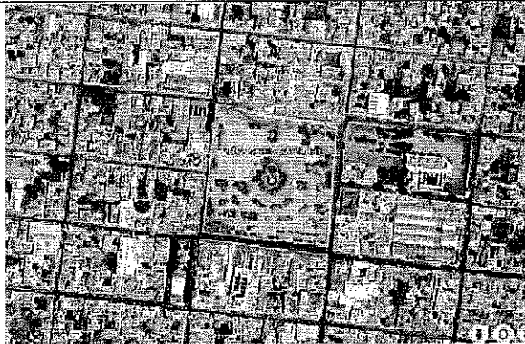
UBICACIÓN DE LA FERIA PATRONAL DE ACATZINGO