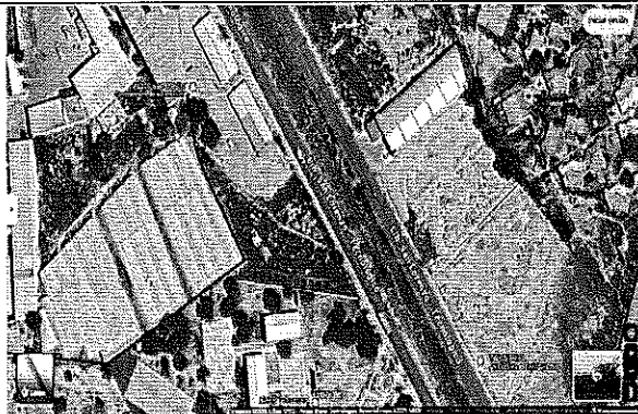
UBICACIÓN DEL ENCIERRO DE CAMIONES, TEHUACÁN