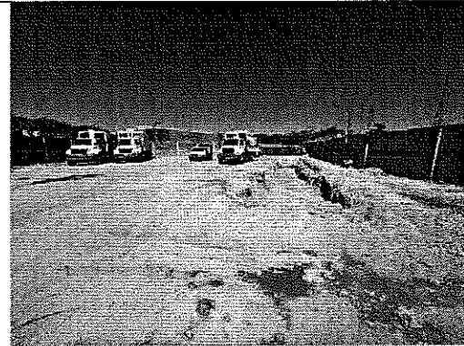
VISTA GENERAL DEL INTERIOR DEL SITIO