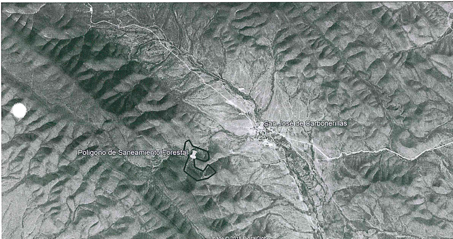
Imagen 1. Vista Satelital de la ubicación del polígono de la Notificación de Saneamiento Forestal del Ejido San José de Carbonerillas, Municipio de Mazapil, Estado de Zacatecas.