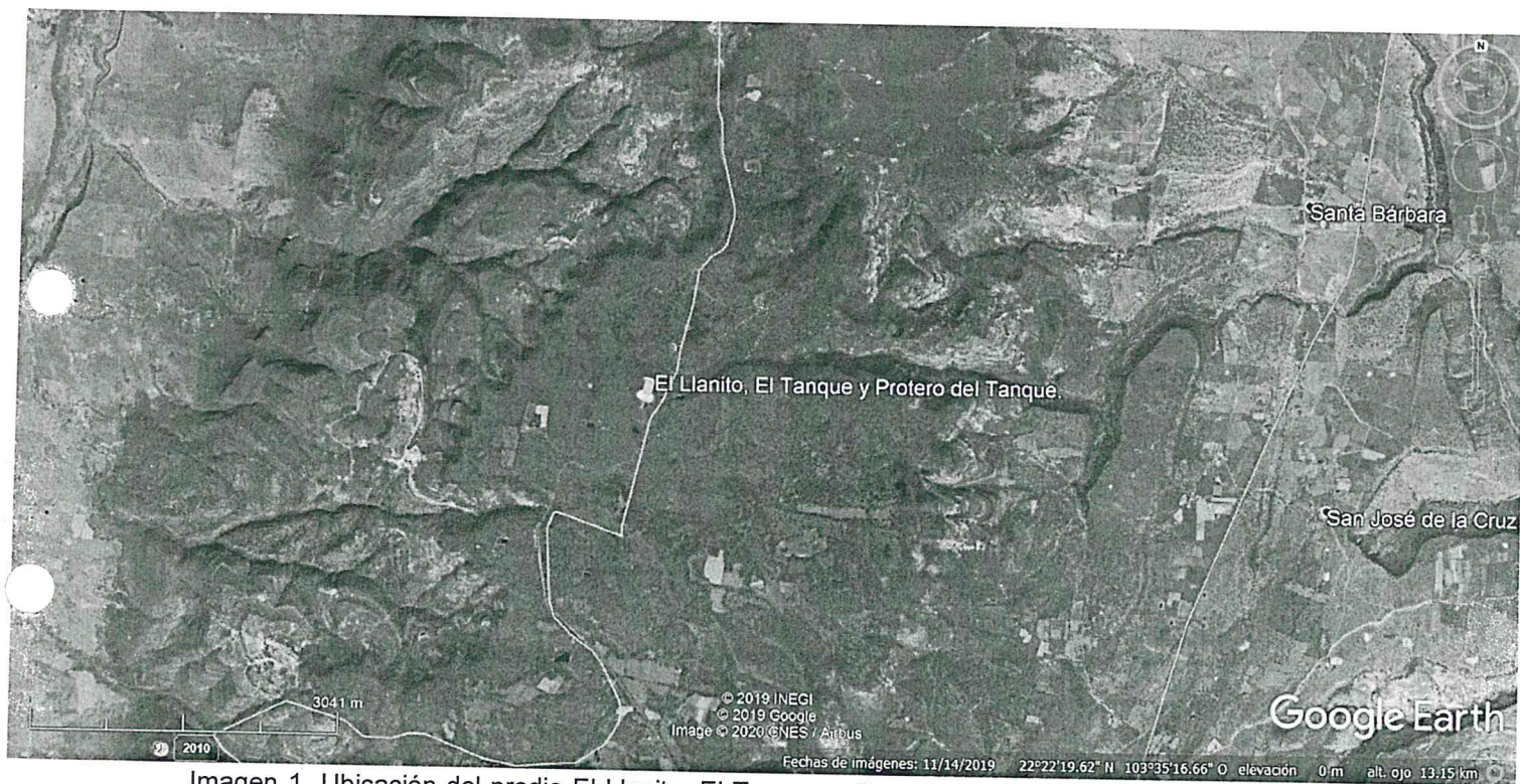
Imagen 1. Ubicación del predio El Llanito, El Tanque y Potrero del Tanque, Zacatecas, donde se llevó a cabo los actos de inspección y vigilancia.