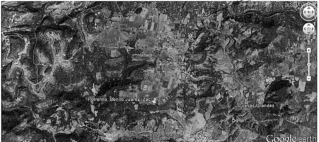
Imagen 4. Ubicación de Terreno forestal, de la Localidad de Potrerillo, Municipio de Benito Juárez, Zacatecas, donde se llevó a cabo los actos de valuación de daños y vigilancia Ambiental.