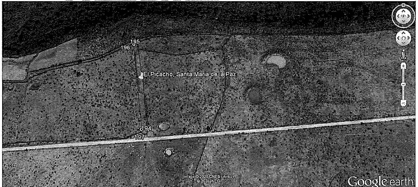
Imagen 3. Ubicación de terreno forestal de la Localidad El Picacho, Municipio de Santa María de la Paz, Zacatecas, donde se llevó a cabo los actos de valuación de daños y vigilancia Ambiental.