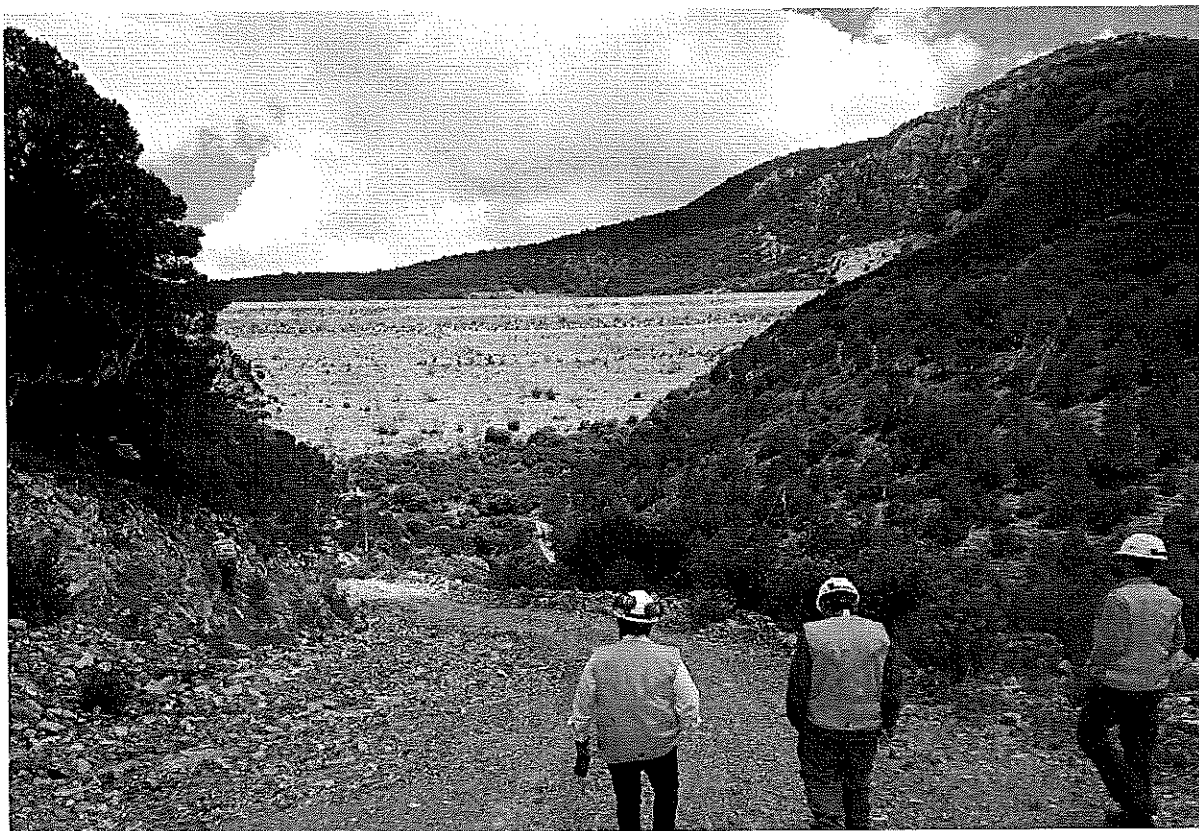
VISITA TÉCNICA AL CUSTF DE MINERA SABINAS EN SOMBRERETE, ZACATECAS