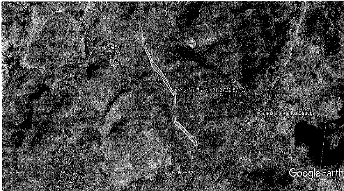
Imagen 1. Ubicación de un punto de aprovechamiento de materiales pétreos encontrados dentro de los Terrenos del Ejido Ahijaderos, Municipio de Pinos, Zacatecas, donde se llevaron a cabo los actos de inspección y vigilancia.