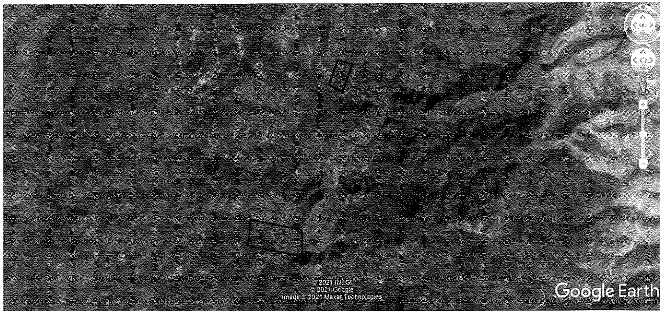
Imagen 1. Terrenos forestales de la Comunidad Agraria San José de la Isla, perteneciente al Municipio de Genaro Codina, Zacatecas, donde se llevaron a cabo los actos de inspección y vigilancia.