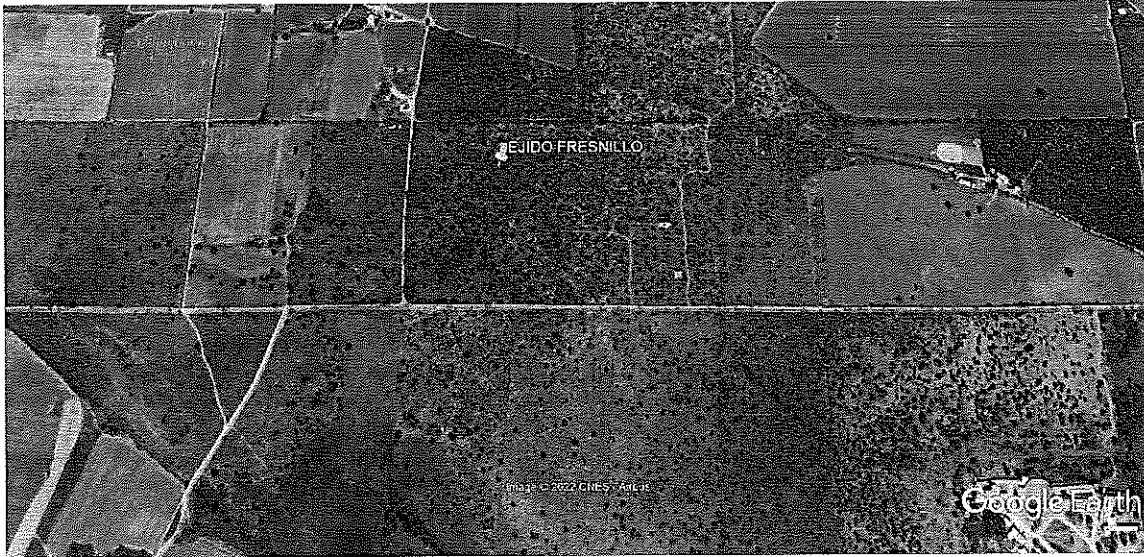
Terrenos del Ejido Fresnillo, Estado de Zacatecas.