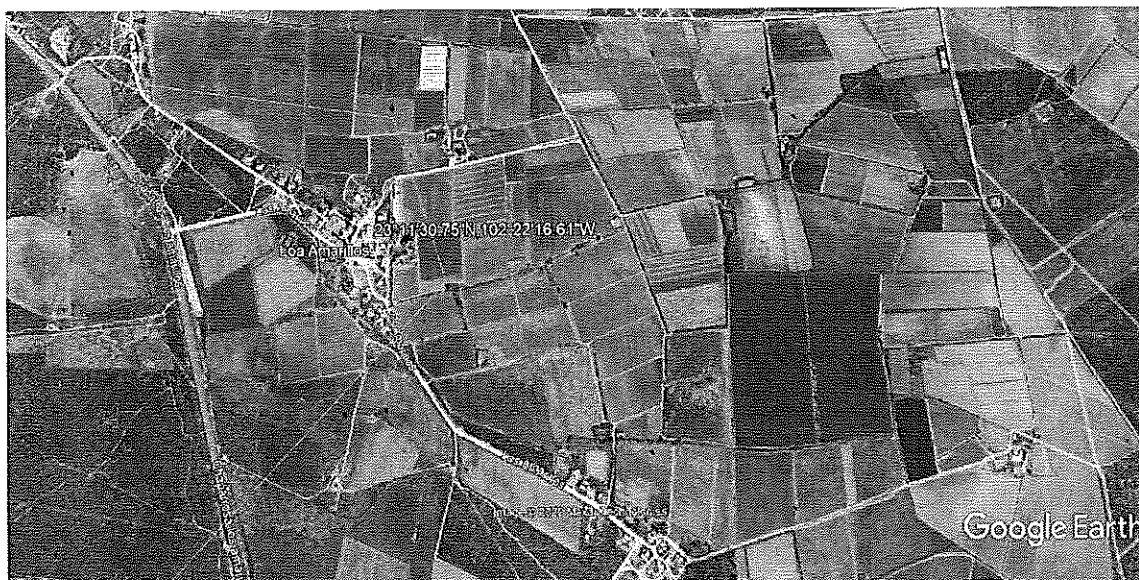
Ubicación de la Comunidad Los Amarillos, Municipio de Villa de Cos, Zacatecas.