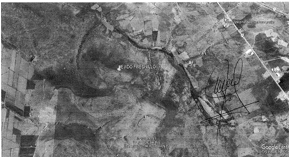
Terrenos Forestales del Ejido Fresnillo, Municipio de Fresnillo, Zacatecas.