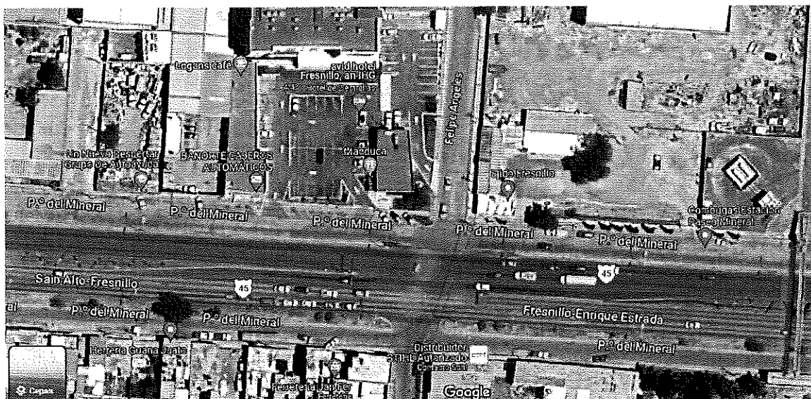
Imagen Ejido Fresnillo en el Municipio de Fresnillo Zacatecas