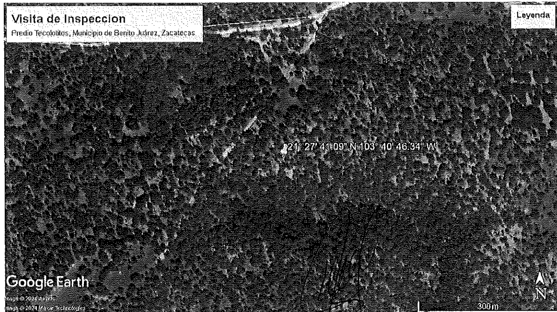
Imagen satelital de la ubicación del predio Tecolotitos, Predio con Notificación para saneamiento forestal en el municipio de Benito Juárez, Zacatecas

Oficina de Representación de Protección Ambiental