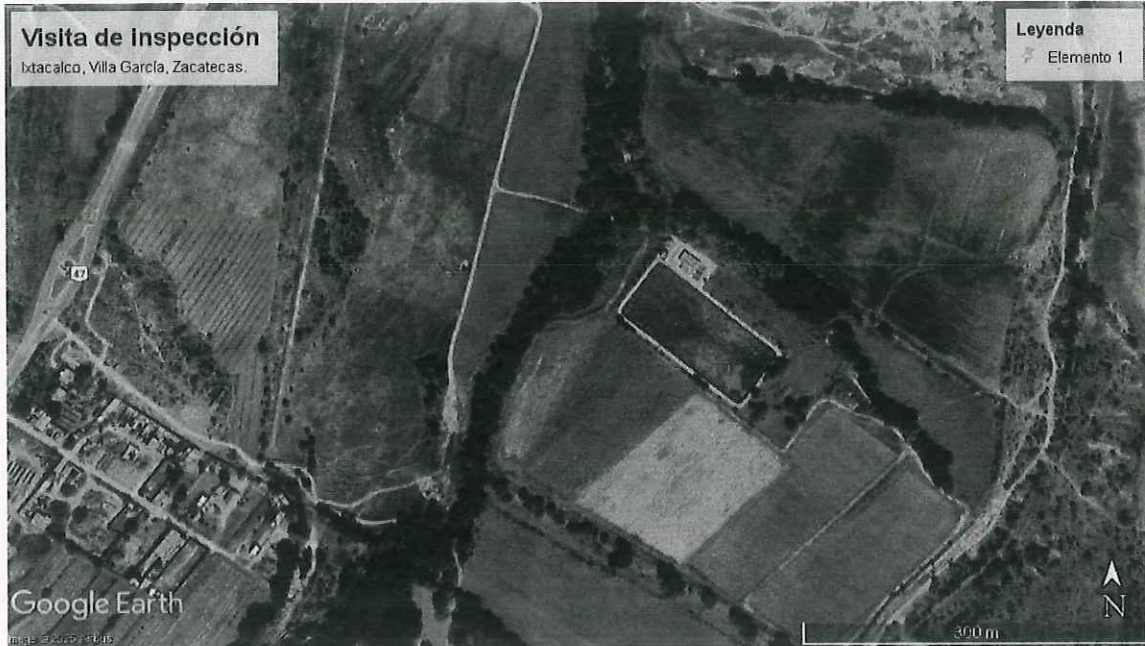
Ilustración 1. Imagen Satelital de la ubicación del predio sujeto a visita en de inspección, Ixtacalco, Villa García, Zacatecas.

**el certificado de transito se encuentra sellado y firmado por Secretaría de Gobierno del municipio de Villa García, Zacatecas, debido a que en el lugar de la comisión, no se encontró autoridad alguna que sellara y firmara el certificado de Transito.