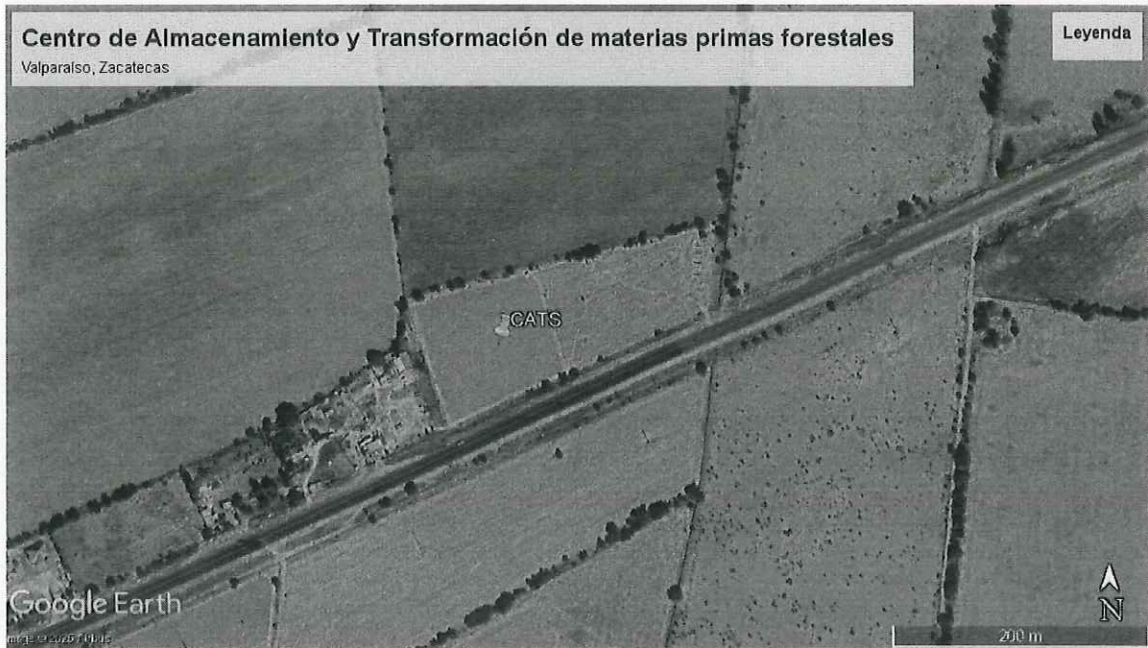
Ilustración 1. Imagen Satelital de la ubicación del predio sujeto a visita en de inspección, Atotonilco, Valparaiso, Zacatecas.