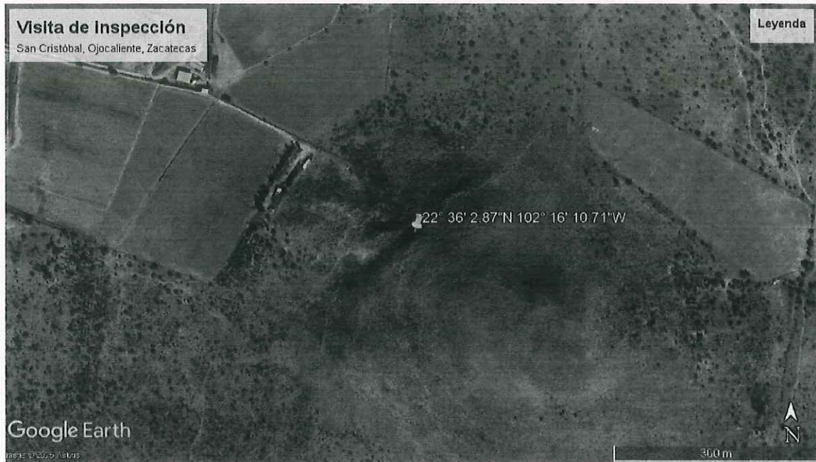
Ilustración 1. Imagen Satelital de la ubicación del predio sujeto a visita en de inspección San Cristóbal, Municipio de Ojocaliente, Zacatecas.

** el certificado de transito se encuentra sellado y firmado por el Delegado Municipal de la Comunidad de San Cristóbal, municipio de Ojocaliente Zacatecas, sin embargo, no exhibo identificación oficial debido a que en ese momento no contaba con ella.