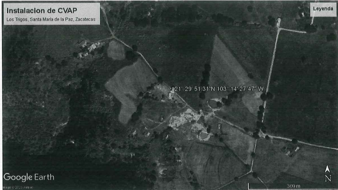
Imagen de la ubicación de la instalación del CVAP, Los Trigos, Santa María de la Paz,, Zacatecas.

**el certificado de transito se encuentra sellado y formado por el Delegado Municipal de la Comunidad de Los Trigos, Santa María de la Paz, Zacatecas, sin embargo, no se cuenta con alguna identificación debido a que al momento de la visita no contaba con ella.