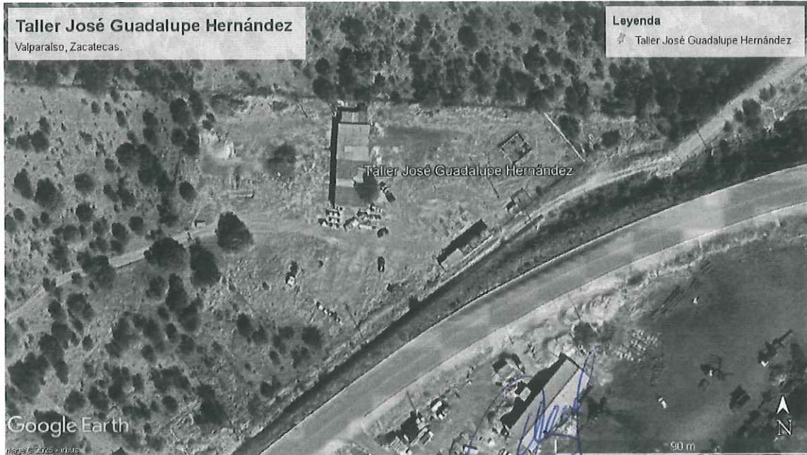
Ilustración 1. Imagen Satelital de la ubicación del predio sujeto a visita en de inspección, Valparaíso, Zacatecas.

*El certificado de transito se encuentra sellado y firmado por el Departamento de Desarrollo Agropecuario y Forestal de la Presidencia Municipal de Valparaíso, Zacatecas, debido a que, en el lugar de la comisión, no se encontró autoridad alguna que sellara y firmara el certificado de Transito.