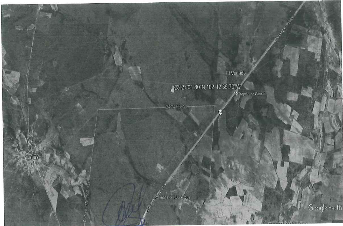
Imagen de la ubicación del Ejido Fresnillo, lugar donde se realizó recorrido de vigilancia, Fresnillo, Zacatecas.