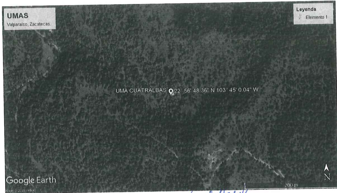
Imagen de la ubicación de uno de los predios sujetos a inspección, UMA CUATRALBAS, Valparaíso, Zacatecas, Zacatecas.

*El certificado de transito se encuentra sellado y firmado por el Departamento de Desarrollo Agropecuario y Forestal de la Presidencia Municipal de Valparaíso, Zacatecas, debido a que en el lugar de la comisión, no se encontró autoridad alguna que sellara y firmara el certificado de Transito.