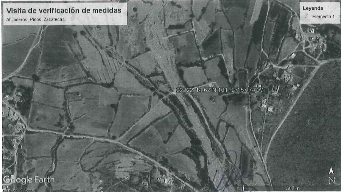
Imagen Satelital de la ubicación del predio sujeto a visita en de Inspección, Ahijaderos, Pinos Zacatecas.