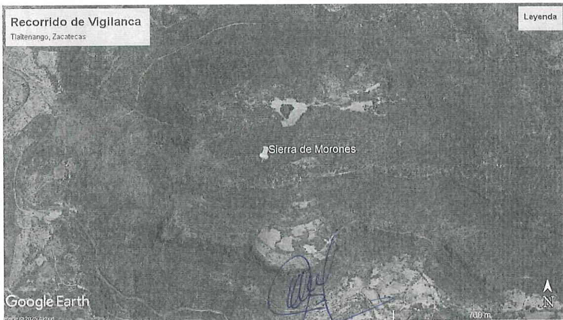
Imagen de la ubicación del recorrido de Vigilancia, Sierra de Morones, Tlaltenango, Zacatecas.

Declaro, bajo protesta de decir la verdad, que los datos contenidos en este formato son los solicitados y manifiesto tener conocimiento de las sanciones que se aplicarían en caso contrario.