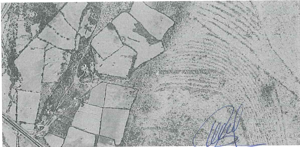
Ilustración 1. Imagen Satelital de la ubicación del Ejido sujeto a recorrido en materia Forestal (Ejido El Trinidad Norte, Zacatecas).

Declaro, bajo protesta de decir la verdad, que los datos contenidos en este formato son los solicitados y manifiesto tener conocimiento de las sanciones que se aplicarían en caso contrario.