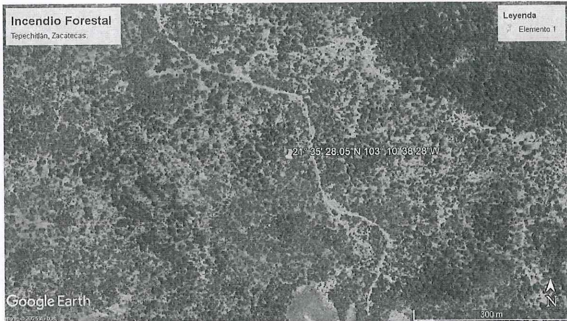
Ilustración 1. Imagen Satelital de la ubicación del predio sujeto a visita en de inspección, Tepechitlán,, Zacatecas.

**el certificado de transito se encuentra sellado y firmado por Secretaría de Gobierno del municipio de Tepechitlán, Zacatecas, debido a que en el lugar de la comisión, no se encontró autoridad alguna que sellara y firmara el certificado de Transito.