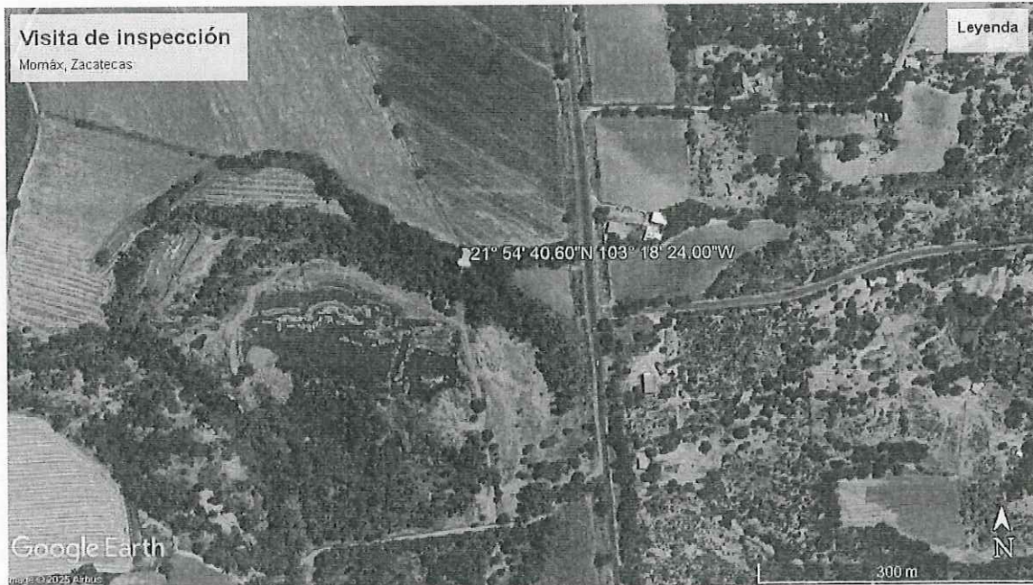
Ilustración 1. Imagen Satelital de la ubicación del predio sujeto a visita en de inspección, Municipio de Momax, Zacatecas.