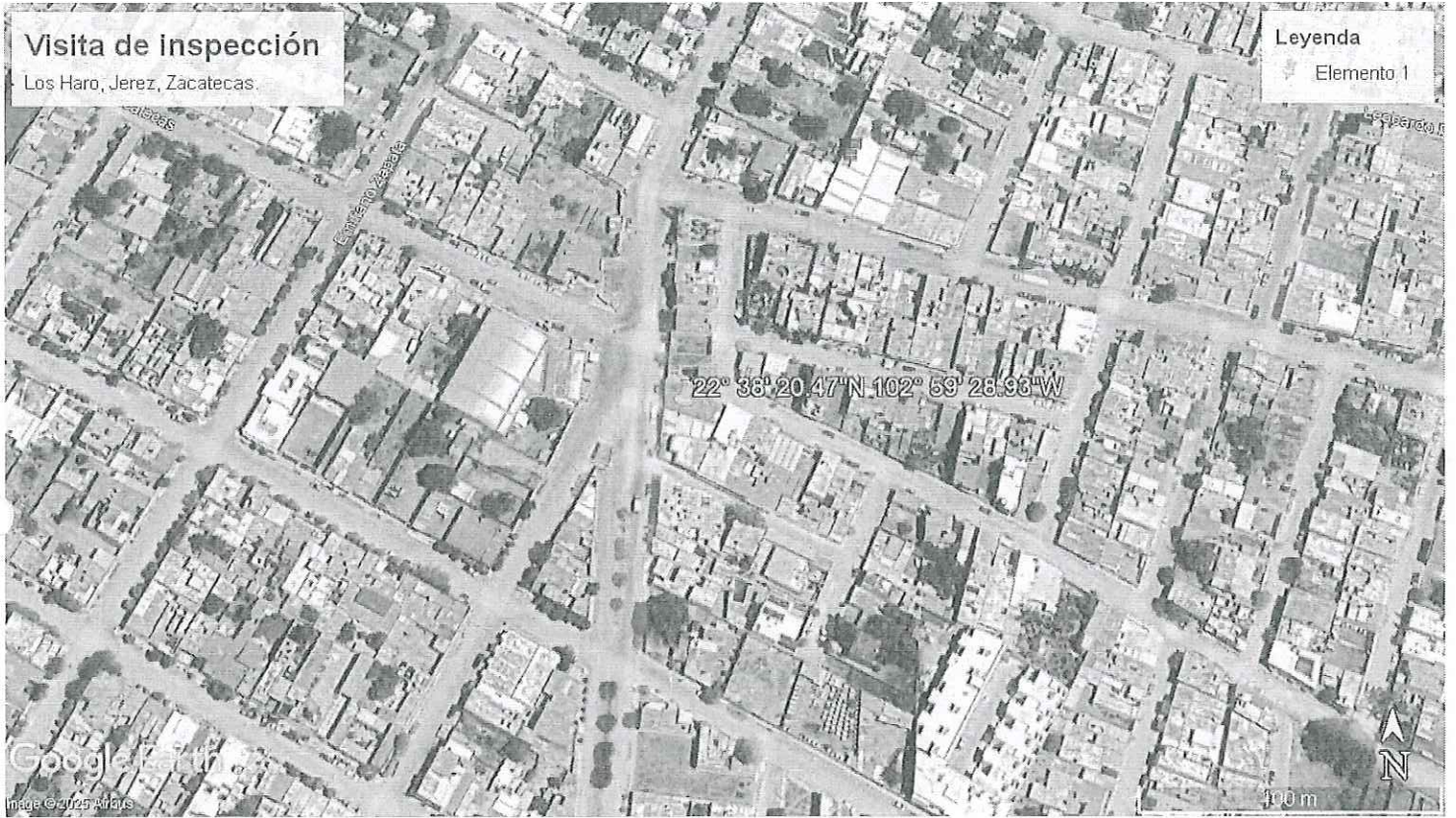
IMAGEN SATELITAL DE LA UBICACIÓN DEL PREDIO SUJETO A VISITA EN DE INSPECCIÓN, LOS HARO, JEREZ, ZACATECAS.