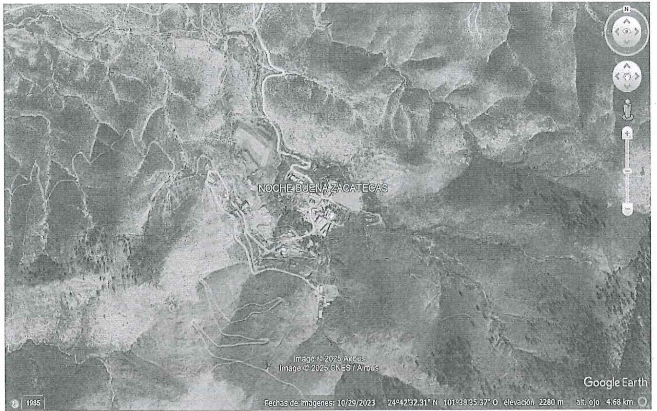
COMUNIDAD NOCHE BUENA, MELCHOR OCAMPO