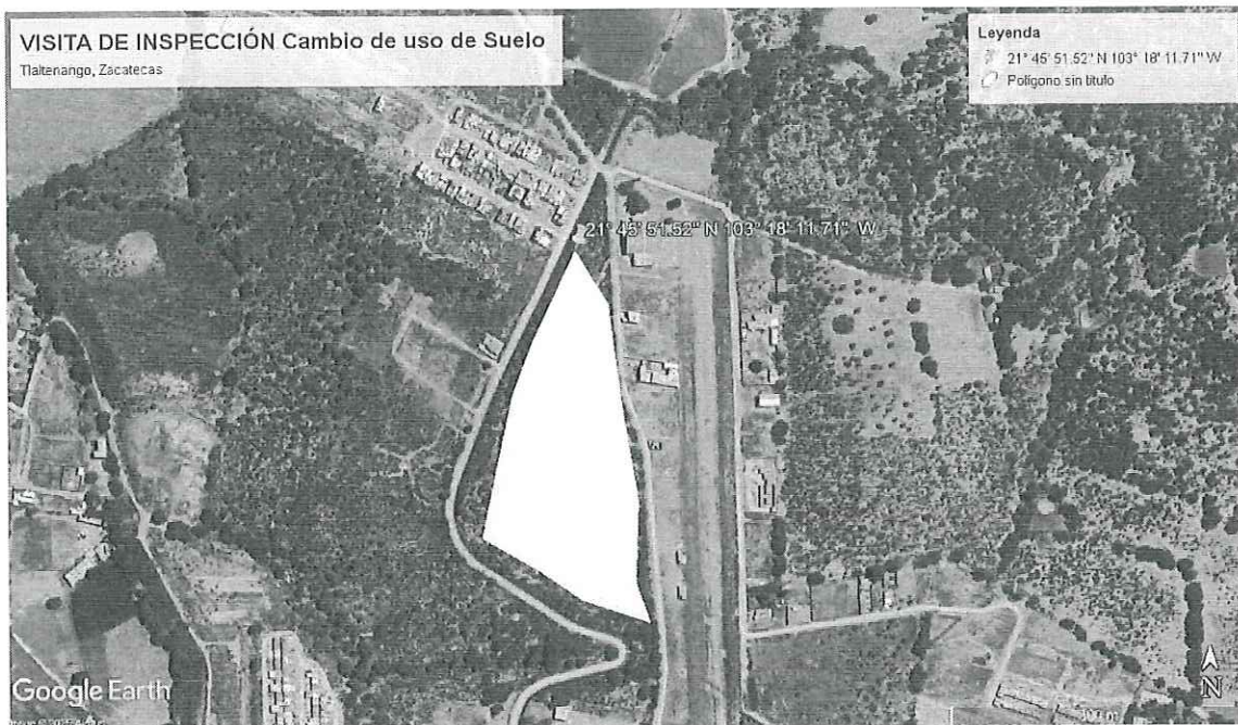
Imagen satelital de la ubicación del predio sujeto a visita de inspección, Municipio de Tlaltenango, Estado de Zacatecas.